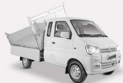
K01H Benne Basculante