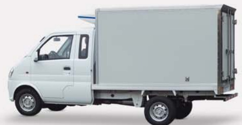
K01H Fourgon Frigorifique