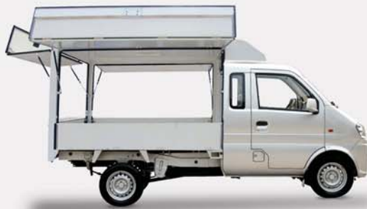
K01H Équipement divers