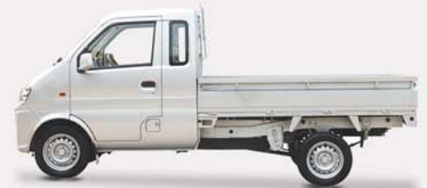
K01H Plateau Ridelles